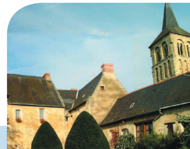
Le presbytère et la perspective sur le clocher roman 12 e

Le presbytère et le clocher roman (XII e ) sont inscrits à l'inventaire supplémentaire des Monuments historiques. Témoignent des graffitis du jardinier Pierre SEUREAU inscrits à la révolution sur l'une des façades du presbytère.