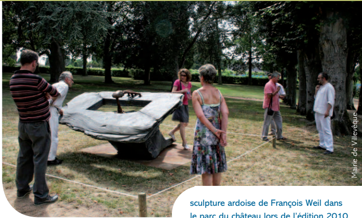
sculpture ardoise de François Weil dans le parc du château lors de l'édition 2010