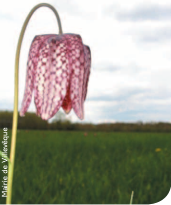
Mairie de Villevêque