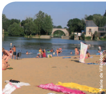
Mairie de Villevêque

La plage de Villevêque est surveillée en juillet et en août