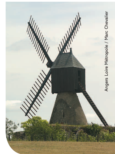
Moulin de la Petite Roche

Pratiquer les sentiers de randonnée, "Sur les coteaux de Savennières" ou "Du Coteau viticole au bocage", fait apprécier la diversité et la beauté des paysages (départ de ces circuits, place du Mail).