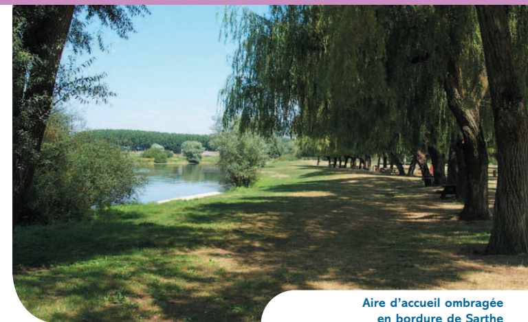
Aire d'accueil ombragée en bordure de Sarthe