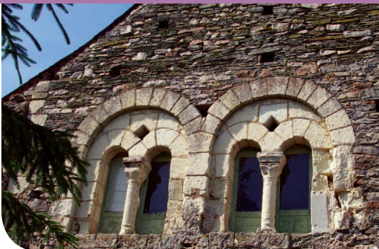
Deux fenêtres du XII e siècle plein-cintre géminées