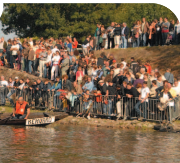
Mairie de Béhuard.

La fête de la Plate, dernier dimanche du mois d'août