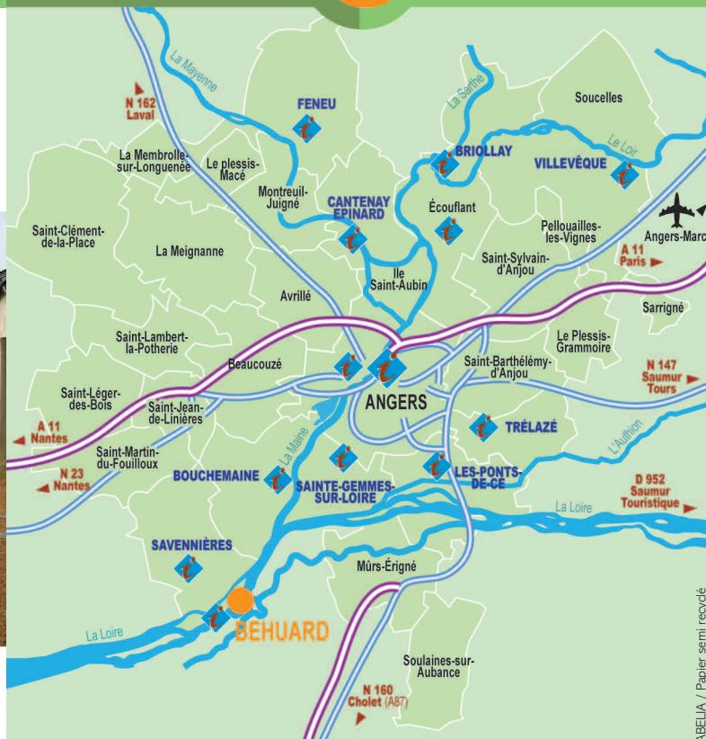
2011 / T. SAUVAGE + ★ EMBLEME 360° / Photo couverture : Angers Loire Métropole / Imprimeur ABELLA / Papier semi recyclé